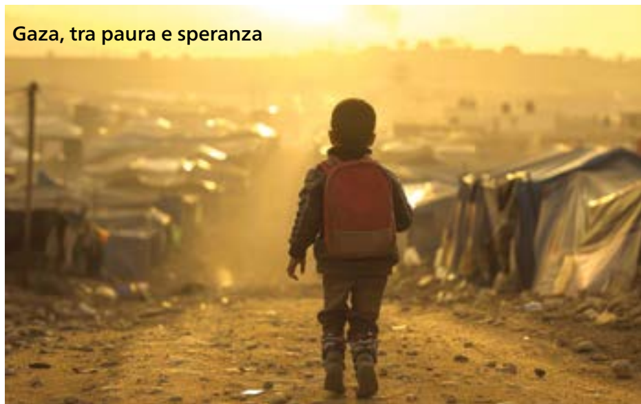
Gaza, tra paura e speranza

Mentre navigavo tra i canali della televisione alla ricerca di un telegiornale, sul video è comparso un signore che non ho riconosciuto, ma che ha manifestato competenza e cultura ricca di storia, di sociologia e di psicologia, il quale, in poche parole, ha citato una frase che mi ha molto colpito: "Quando un popolo diventa gregge, ha bisogno di un animale che lo guidi" (Friedrich Nietzsche). Ho subito pensato al secolo scorso, il '900, quando il mondo occidentale è finito nelle mani di tre dittatori (per non parlare dei più piccoli): Stalin con almeno sette milioni di morti in Siberia, Hitler con i campi di sterminio e i forni crematori, e Mussolini che, come insegnante elementare di prima nomina ha vissuto a Tolmezzo, dove io personalmente ho conosciuto tante persone che hanno vissuto accanto a lui. Sentendo