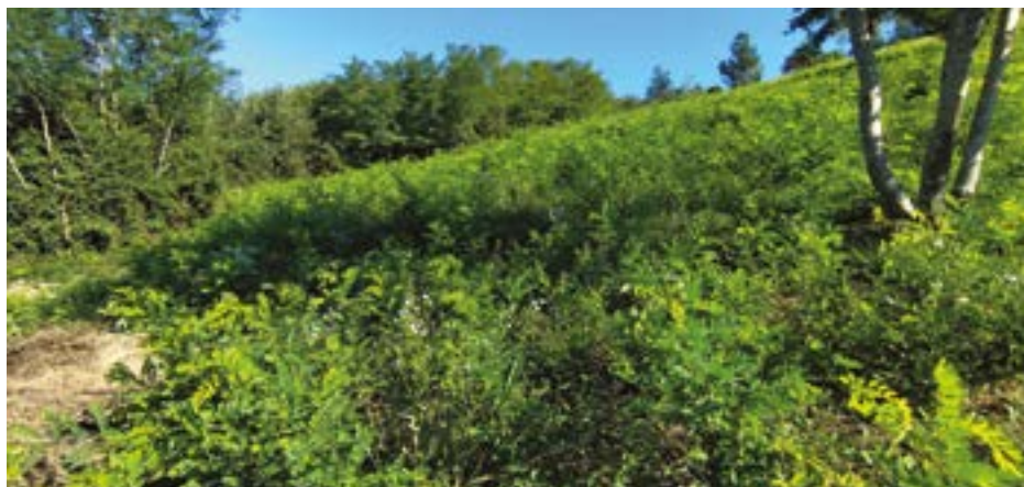
Sotto. La collina di Villalta, prima della pulizia delle robinie e dopo.