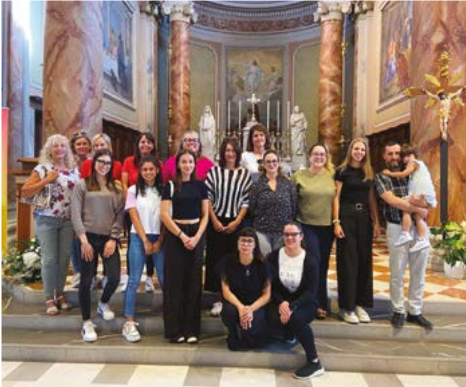
Insegnanti e maestre delle nostre Scuole parrocchiali.

tazionale e al Metodo STEM. Si tratta di un'educazione al pensiero logico e analitico diretto alla soluzione di problemi che, impiegato in contesti di gioco educativo, permette all'alunno di dispiegare al meglio le proprie potenzialità, proprio perché egli ne constata immediatamente le molteplici e concrete applicazioni. Ciò contribuisce alla costruzione delle competenze matematiche, scientifiche e tecnologiche, ma anche allo spirito di iniziativa, nonché all'affinamento delle competenze linguistiche.