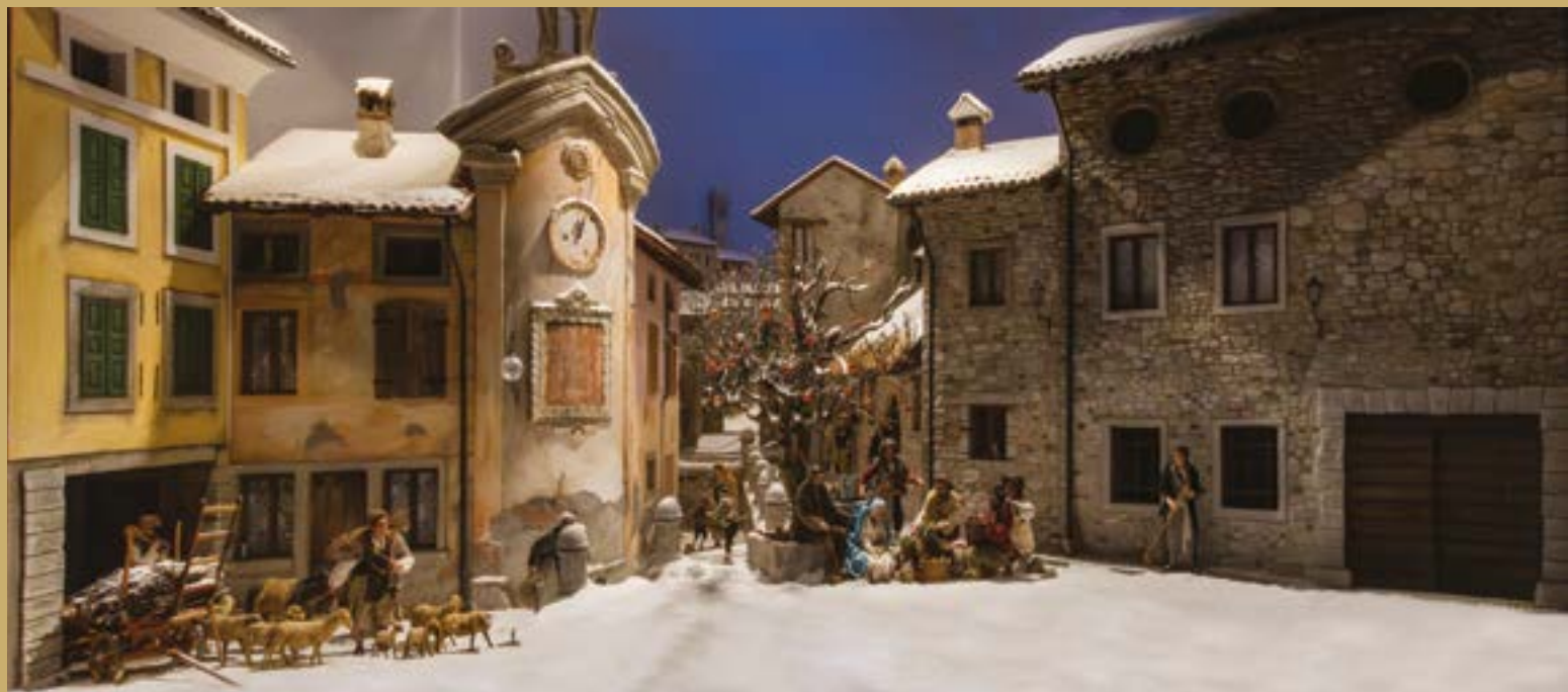
Presepe raffigurante alcuni scorci di Fagagna, realizzato nel Duomo di San Daniele per il Natale 2024 dal "Gruppo amici del presepe"

Siamo pronti a lasciare le nostre piccole certezze e appagamenti terreni per vivere l'avventura della fede che salva?