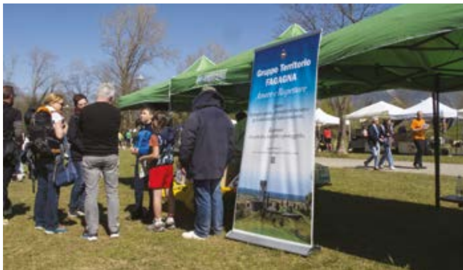
Sopra. Osoppo, Aprile 2025: "Ti regalo il mio tempo".