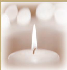
43 BELLON BENVENUTO